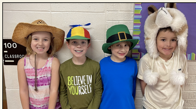
La Primaria Lincoln celebró al Dr. Seuss con el Día del Gato en el Sombrero.

Del 21 al 27 abril es la Semana Nacional de Reconocimiento al Voluntario. Un gran AGRADECIMIENTO a nuestros numerosos voluntarios que generosamente dan su tiempo y talentos para marcar la diferencia en tantas vidas.